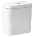
Cisterna de doble descarga 6/3L con alimentación inferior para inodoro