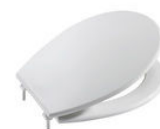
Tapa y asiento para inodoro