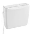
Cisterna alta/semi alta de plástico de doble descarga 6/3L para inodoro de tanque alto