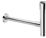
Sifón botella de 1 1/4" para lavabo. Tubo de 300 mm