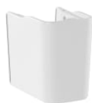
Semipedestal para lavabo de porcelana