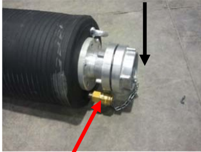
Enchufe rápido de hinchado