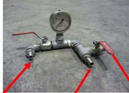
Entrada aire compresor