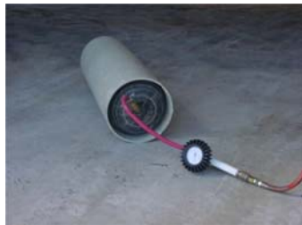
obturador chador con ro.